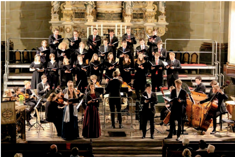
Konzert in der Marienkirche Pirna

In der Woche vor den Konzerten fand eine intensive Probenarbeit statt. In verschiedene Abschnitte aufgeteilt und von einem bunten Abendprogramm umrahmt erarbeiteten die Dirigenten zusammen mit dem Hochschulchor die Werke. Auch Orchester- und Solistenproben kamen dabei nicht zu kurz. Die Hauptprobe am Ende der Woche zeigte dann die Früchte dieser Arbeit.