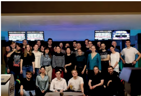
Nach dem Bowling in Stavenhagen

Vor allem die beiden Kompositionen von Lübeck und Buxtehude hatten an der Basedower Orgel einen ganz besonderen klanglichen Reiz! Ein anderer Teil von uns machte sich während der Seminarzeit auf nach Warnemünde, um den freien Tag bei Fischbrötchen essen und Wellen schauen zu verbringen. Am Abend trafen wir uns dann alle wieder in der Stavenhagener Bowlingbahn, um den freien Tag ausklingen zu lassen.