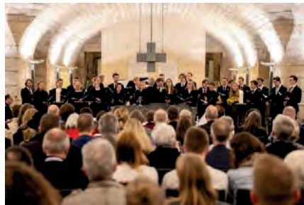
Abschlussandacht der EKD-Synode