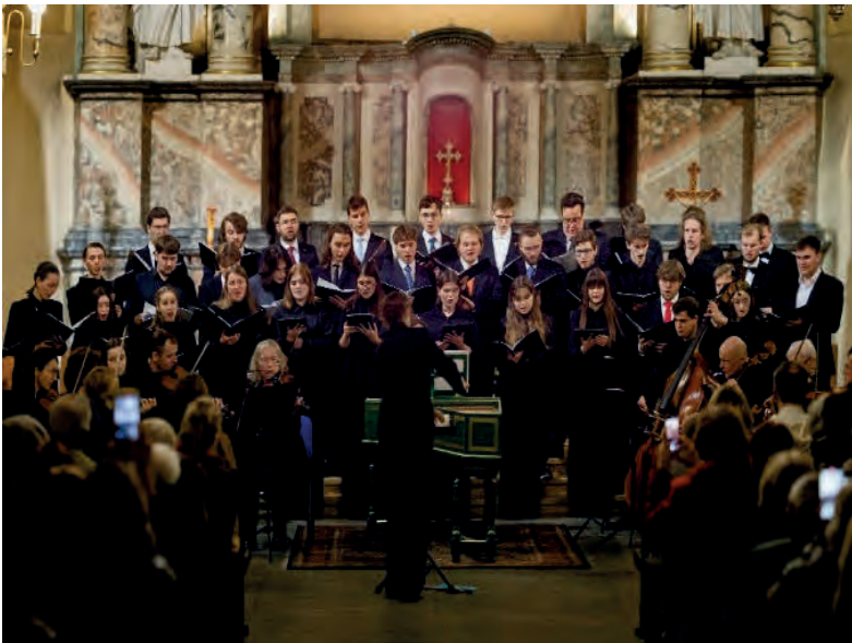
Konzert in Vilnius