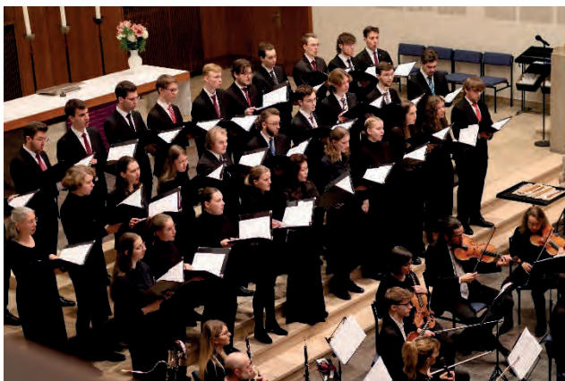
M. Drude: Weihnachtsoratorium