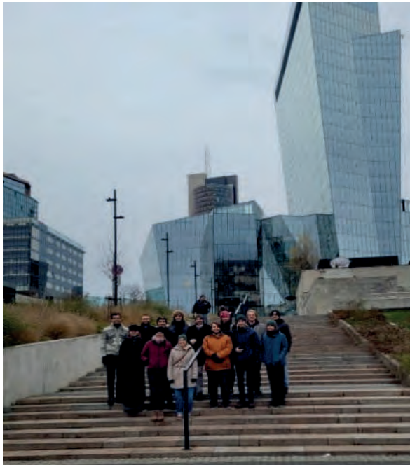
Vilnius

stellung über die Werke von Mikalojus Konstantinas Čiurlionis besuchen. Dieser ist so etwas wie der litauische Nationalkünstler, was die bildende Kunst und Musik angeht. Von ihm sangen wir im Konzert auch zwei Sätze einer Messe, die der litauische Studierende mit uns einstudierte. In der Ausstellung hatten wir das berauschende Erlebnis einige der Gemälde Čiurlionis' von innen ansehen zu können.