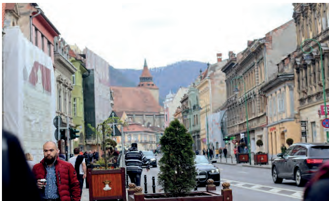
Schwarze Kirche in Kronstadt

Den letzten Tag unserer Reise verbrachten wir damit, eine für die Region typische Kirchenburg zu besuchen. Die in sich Tartlau befindende Kirchenburg gehört zum Weltkulturerbe und ist eine der am besten erhaltenen Kirchenburgen Siebenbürgens. Wie der Name schon sagt, steht hier eine Kirche im Zentrum, um die herum eine Burg errichtet wurde, wo die Menschen hinein flohen, um sich vor Angriffen zu schützen. Ein beeindruckendes Bauwerk!